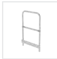
Stirnseitiges Geländer Bestell-Nr. 650103 – 650105