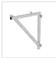
Dreieckskonsole Bestell-Nr. 600100 – 600102, 600129