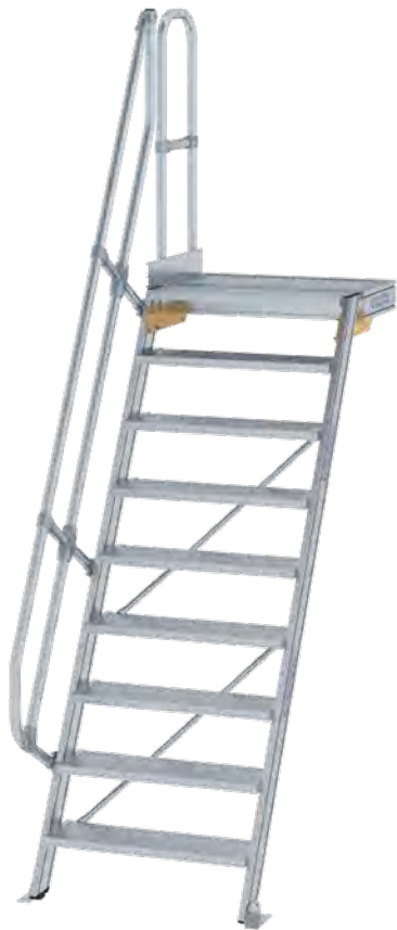
Abb. Bestell-Nr. 600389