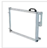
Sicherungs- schranke Bestell-Nr. 690746 – 690748